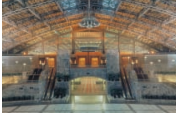
Pennsylvania Convention Centre - Grand Hall

una incredibile collezione di quadri di Cézanne, Renoir, Monet, Manet, Gauguin, Delacroix, Rousseau e Degas oltre all'opera forse più famosa di Van Gogh, i Girasoli. Tra le opere moderne si segnalano quelle di artisti come Klee, Brancusi, Braque, Mirò, Dalí, De Chirico, Duchamp, Matisse e Picasso. Il museo conta anche una nuova sede nel Perelman Building, che sorge a poca distanza, e che costituisce la prima fase di un piano volto a modernizzare il Philadelphia Museum of Art.