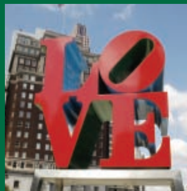
La celebre scultura di Robert Indiana

Una delle scelte più valide per soggiornare a Philadelphia è senz'altro lo Sheraton Society Hill ( www.sheraton.com ), che si trova nel cuore un quartiere conosciuto per i ristoranti, negozi, gallerie e locali, ad un passo dalla Independence Hall e dalla Liberty Bell. La sua atmosfera classica riporta all'epoca coloniale, ma l'albergo è dotato di tutte le tecnologie di punta, inclusa la connessione Wi-Fi in tutte le stanze e le aree comuni. Le camere sono 365 , arredate in stile classico, e dotate del confortevole letto Sheraton Sweet Sleeper (SM). Le migliori per gli uomini d'affari sono le Sheraton Club Guest Room che hanno una grande scrivania, telefono con due linee, sedia ergonomica, stampante e fax e accesso gratuito alla fitness room e al Club Lounge , che offre un'ottima colazione mattutina, l'aperitivo alla sera e bevande tutta la giornata. Per il relax c'è una piscina coperta riscaldata, una vasca jacuzzi e un fitness centre. Lo Sheraton Society Hill ha 1.600 mq di spazi meeting, tutti al piano terra, suddivisi fra 17 sale tra cui una ballroom di 724 mq che può ospitare 900 persone.