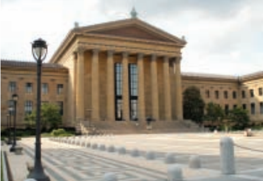
Philadelphia Museum of Art