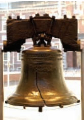
La Liberty Bell